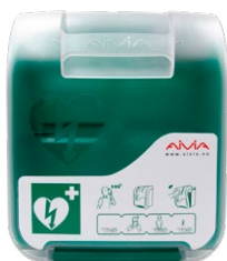
Sydäniskurikaappi, kevyt sisätiloihin