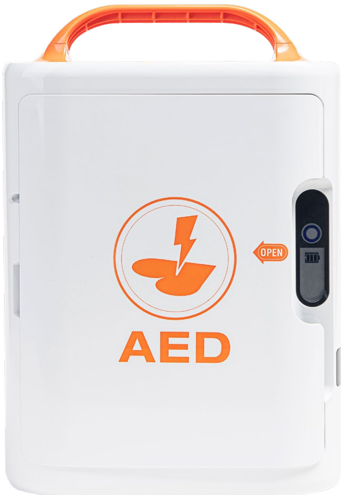
Mediana A16 -sydäniskuri

Mediana A16 -sydäniskurissa on virtalähteenä akku , jonka säilyvyys on viisi vuotta. Akun virta riittää 200 iskuun (200 J) tai yli 6 tunnin käyttöön. Lisäksi laitteeseen kuuluu kertakäyttöiset elektrodit , jotka tulee vaihtaa aina käytön jälkeen tai kun niiden pakkauksessa mainittu viimeinen käyttöpäivä on ylitetty. Elektrodien säilyvyys on kolme vuotta. Samat elektrodit sopivat aikuisten ja lasten (yli 1-vuotiaat) elvytykseen.