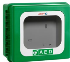
Sydäniskurikaappi kylmiin olosuhteisiin