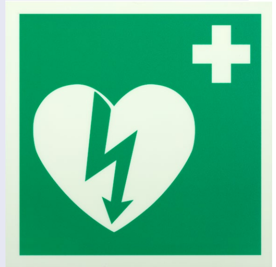
Kansainvälinen tunnus sydäniskurin sijainnin merkitsemiseen.