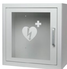
Sydäniskurikaappi, metallinen sisätiloihin